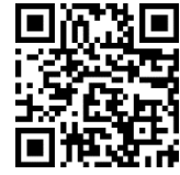
ボランティア登録フォーム