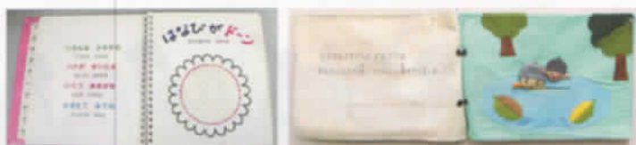
写真左 点字絵本「サワッテゴラン ナンノハナ?」岩崎書店