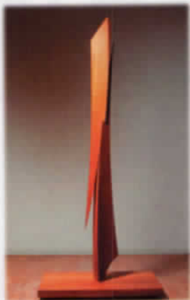
澄川氏の作品「そりのあるかたち」2012

そして、年に3回の企画展や多くの体験学習を実施しています。今は「文化の秋」。みなさまのご来館をお待ちしています。