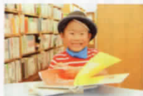
夏休み中の元町こども図書館にはたくさんの子供が本を読みに来ていました。