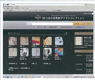
国立国会図書館デジタル コレクショントップ画面

図書館のホームページにつきましても、視覚に障害のある方にご利用いただけるよう、音声読上げ機能、文字色の反転機能を追加します。