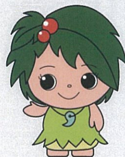
郷土博物館 マスコットキャラクター ひいらぎちゃん

重要有形民俗文化財は平成29年1月現在、国内の217件が指定されており、都内では9件目の指定となります。「衣生活」として重要有形民俗文化財となっているものは「津軽・南部のさしこ着物」、「庄内の仕事着コレクション」など仕事着や作業着が主なもので、「清瀬のうちおり」のような生活に密着した普段着はなく、洋服が普及する以前の衣生活や、養蚕や織物を行った多摩地域の家庭の衣料事情を知ることができ、我が国の衣生活の変遷を考える上で重要なものとされました。