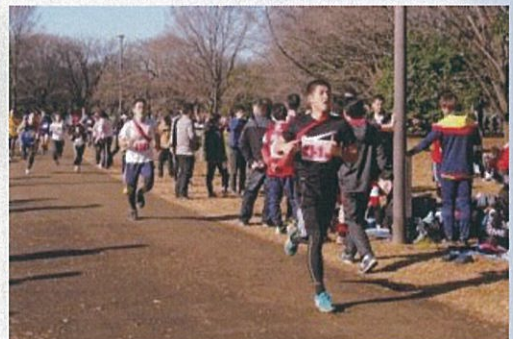
思いをのせた褌をつなぐランナーたち

平成28年12月23日(金)に都立小金井公園にて、清瀬市・小平市・東村山市・東久留米市・西東京市の圏域五市でリレーマラソンが行われました。全体で139チーム1,211名、清瀬市からは13チーム110名が参加しました。チームの構成は家族や友人、職場の仲間と様々で、フルマラソンと同じ距離の全長42.195km、計23周を褌をつないで走りました。清瀬市からは、4人で挑んだ「清瀬二中