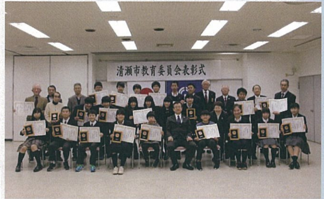
表彰式終了後の受賞者の皆さん