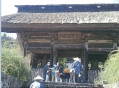
中山道ウォーキングの様子