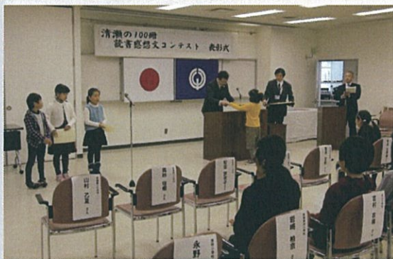
表彰式の様子(小学校低学年の部)