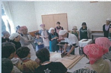
そば打ち体験の様子