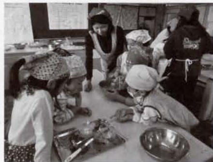
スイートポテト作り

農園の作物をとおして、地域の方や保護者と連携しながら自然の恵みを味わう体験を続けています。