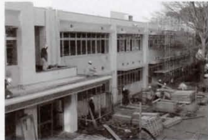
建設中の清瀬第三小学校南校舎