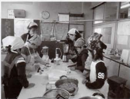
にんじんジャム作り