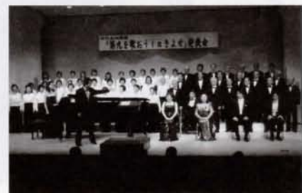
「第九を歌おう in 清瀬」発表会

ホールは音響性能にとっても優れた作りとなっており、小ホールにはアップライトピアノが設置され、演奏やダンスの練習などにご利用いただけます。会議室等の施設もございまして、ぜひご利用ください。