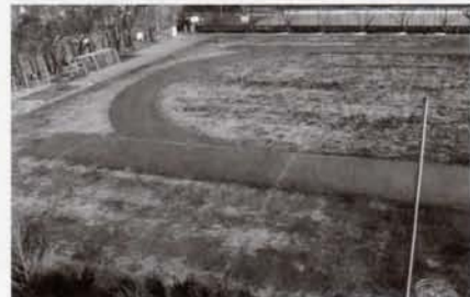
清瀬第三中学校 芝生校庭