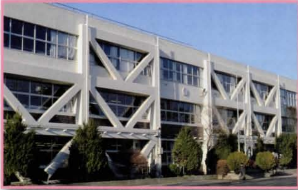
清瀬第七小学校 耐震化校舍