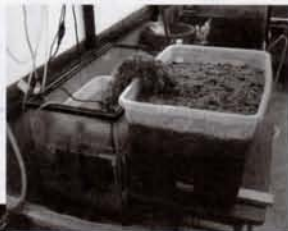
ホタルの飼育装置

このような活動には、地域の有志や「清瀬の自然を守る会」、「川づくり清瀬の会」の方々の多大な協力を得ています。