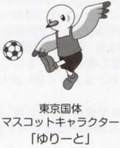
東京国体 マスコットキャラクター 「ゆりーと」

※下宿第三運動公園サッカー場は平成23年の秋ごろより人工芝生化工事を開始する予定です。工事期間中はご利用できませんのでご了承ください。