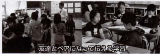
友達とペアになって伝える学習

1月28日、清瀬市の教育課題研究指定校2年目として、研究発表会を行いました。遠くは北海道や九州からも参加者があり、低・中学年は国語、高学年は外国語活動の授業公開を全校級で行いました。友達とやり取りする場面を入れることで全員が主体的に学習し、表現できる機会を作ってきました。