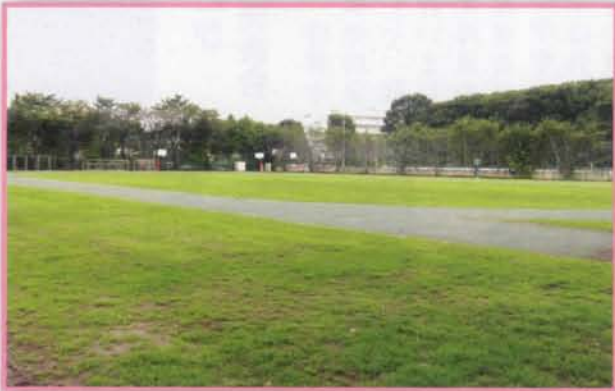
清瀬第三中学校 芝生校庭