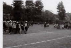
「すっからかん大作戦」

などをして遊びます。中には学校北側の「せせらぎ公園を散歩しよう」というユニークな企画もありました。