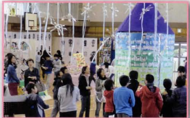
清瀬第八小学校 展覧会