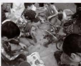
枝を使ってリースづくり