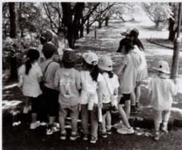
にっここ班でオリエンテーリング

1年生から6年生まで全学年が入っている縦割り班を「にっここ班」と呼んでいます。4月に班を作ってスタートし、集会や全校遠足など1年間を通して活動します。国際交流会で外国の方々を招いたときも、にっここ班で交流しました。3月にはお世話になった6年生へ寄せ書きを贈ります。