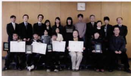
平成 22 年度教育委員会表彰