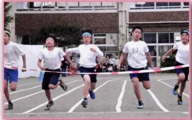
小学校連合運動会「100m走」