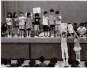
スピーチする3年生。終わったら大きな拍手が。

清瀬第四小学校では月曜日の全校朝会で、各学年の児童が毎回2名ずつスピーチをしています。体験したことや頑張っていることなど、話題はさまざま。共通しているのは、どの学年もメモは持たないでみんなの顔を見ながら自分の言葉で話していることです。聞く児童も誰が何を話すのか興味津津。大変静かに集中して聞いています。「自分も全校朝会で話してみたい」と意欲的な児童がたくさんいます。