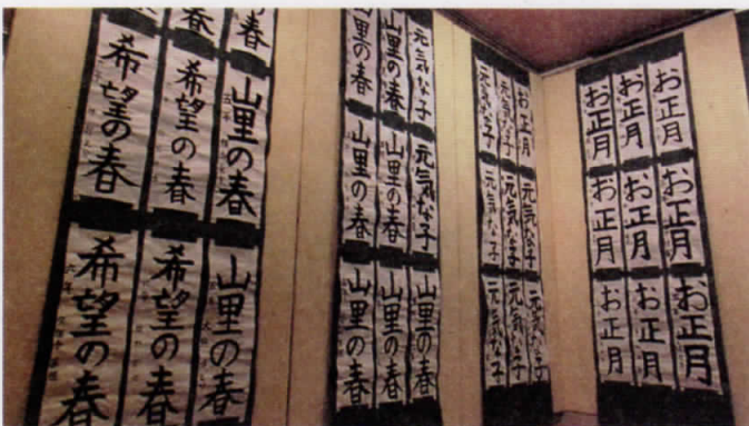
小中学校書き初め展