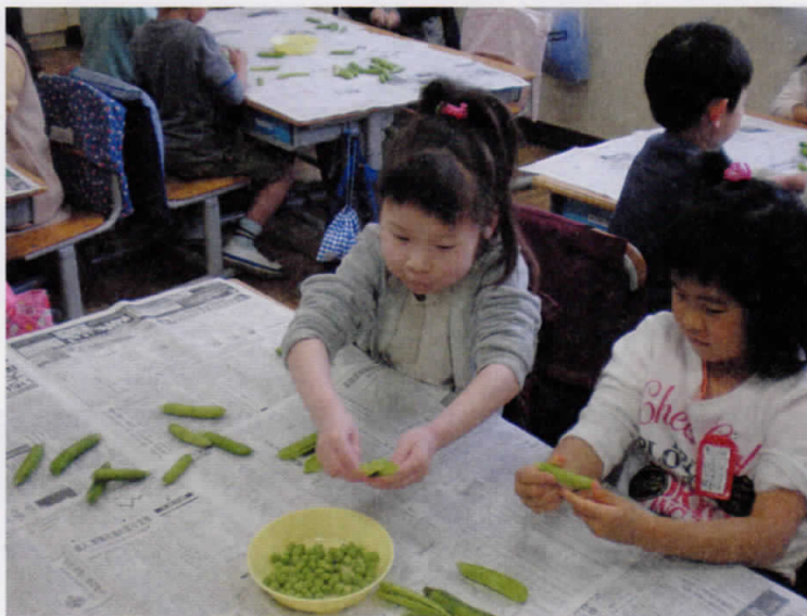
グリーンピースのさやをむく1年生

これらの食育活動や各学級での担任教員による給食指導、栄養士の巡回などにより食べ残しの量は減ってきていますが、食事中のマナーや配膳の仕方についてはまだまだ課題も多くあり、今後の食育活動のテーマにしていきます。