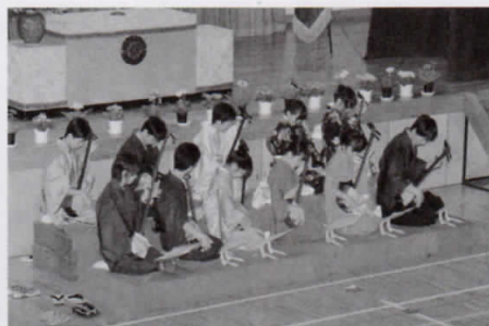
記念式典での箏曲部の演奏

儀正しく落ち着いていて、来賓の方々から「素晴らしかった」とお褒めの言葉をいただきました。これも開校以来温かく見守ってくださった保護者や地域の皆さんのお陰であると感謝します。