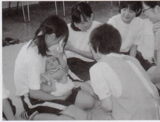
赤ちゃんとふれ合う生徒たち

また、家庭科の選択授業では「赤ちゃんのチカラプロジェクト」と題し、お父さん・お母さんになったつもりで実際に赤ちゃんとおふれ合う体験をしました。赤ちゃんをあやしたり、本の読み聞かせをしたりして、自分たちが小さいころにしてみたら、今度は自分たちがしてみることにより、その難しさや命の尊さを学びました。