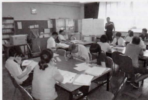
外部講師による校内研修

教職員に対しても徹底した研修を実践しています。外部講師による校内研修の実施や、教職大学院・関係諸機関との連携事業の実施により、人権意識の向上を図っています。