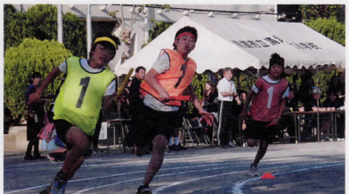
小学校連合運動会 リレー