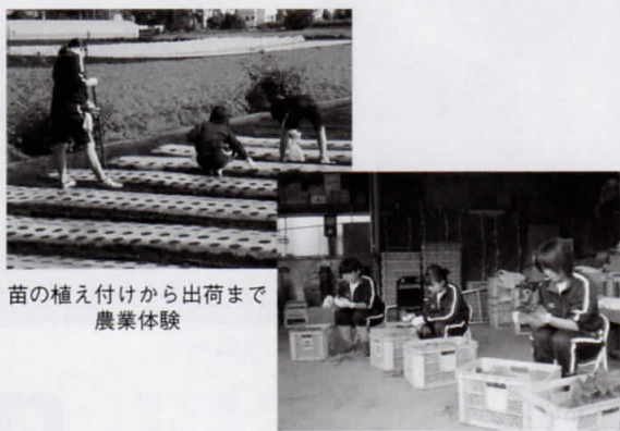
苗の植え付けから出荷まで 農業体験

教育の原点はどの子も「かけがえない存在」として大切にされることです。そして子供の豊かな心や意欲は、自分の居場所があり、温かい人間関係のもと、様々な体験活動を