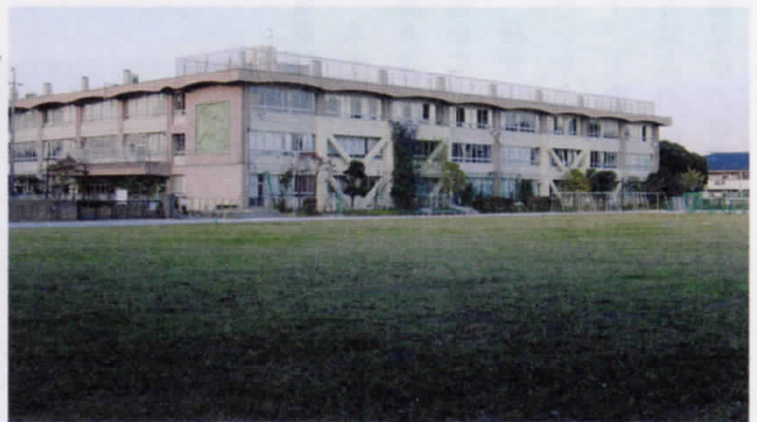
芝生化された清瀬第五中学校の校庭