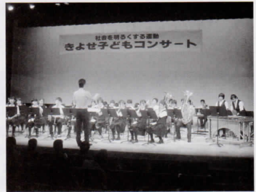
きよせ子どもコンサートで演奏

吹奏楽部では「社会を明るくする運動」の一環として7月にけやきホールで開催された「きよせ子どもコンサート」に出演したり、市内の高齢者福祉施設を訪問して演奏をしたりしています。地域の中に生きる様々な人々と協力しあうことを学びました。