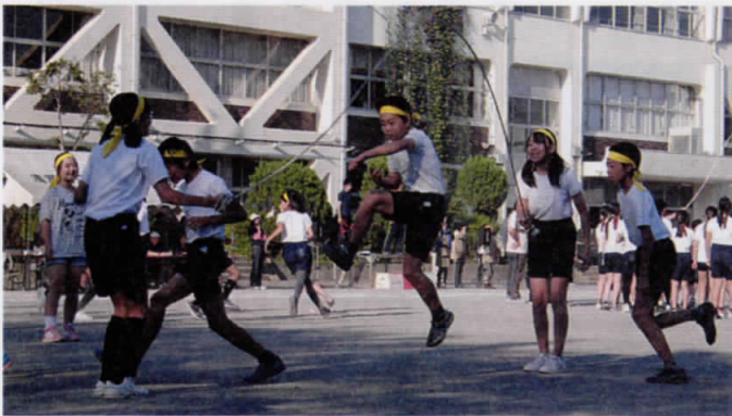
小学校連合運動会 長縄跳び