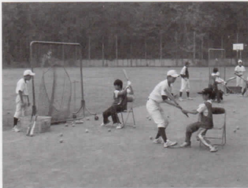
芝生校庭で野球部の部活動体験

学校の環境整備・緑化推進として、昨年夏から校庭の芝生化と校舎壁面の緑化に取り組みました。秋からは芝生の校庭で体力向上を兼ねた「校内マラソン大会」や小学校と連携した「部活動体験」を実施しました。