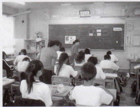
学習支援員による英語指導

授業では、数学の少人数授業や英語の学習支援員を活用したきめ細かな指導を展開しています。さらに今年度は外部ボランティアの活用を図り、3年生では「都立高校受検基礎講座」を2学期から週2回開講しました。ほぼ全員の生徒から満足の声があがっています。