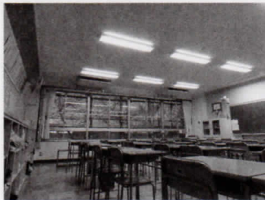
普通教室に設置されたエアコン

平成23年度に8校、平成24年度に6校の整備を実施します。整備するエアコンは節電対策と環境への影響等を考慮し、ガスヒートポンプ方式としました。