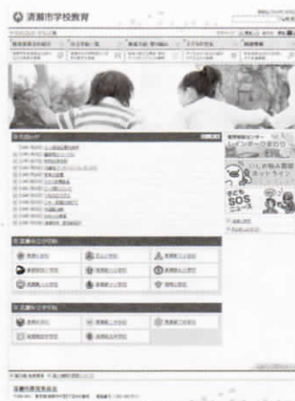
学校教育トップページ