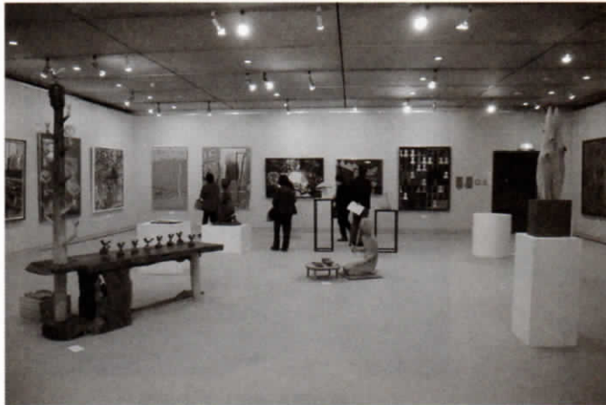
清瀬美術家展 会場の様子