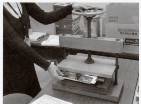
締め機を使用しての修理