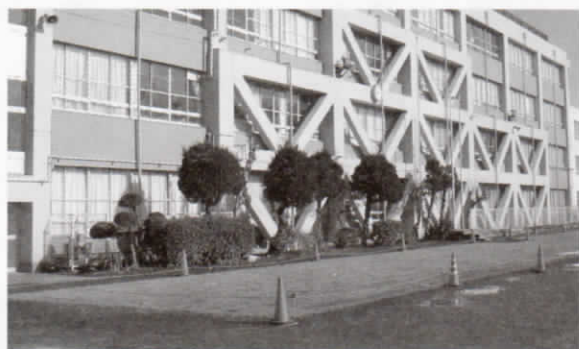
清瀬第十小学校 (冬芝)