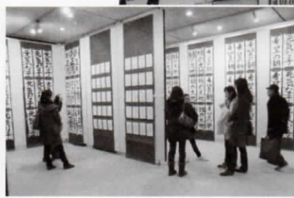
新春書初め展 会場の様子