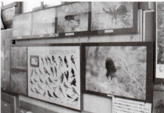
清瀬第七小学校「野鳥と樹木のはくぶつかん」