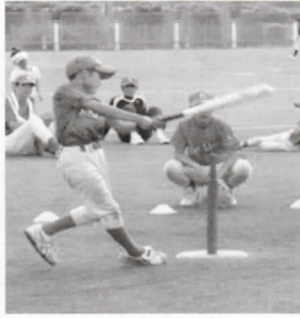
ナイスバッティング！

ティーボールとは、バッティングティーにボールを乗せた状態からボールを打つ、野球に似ているスポーツです。やわらかいボールを使いケガの心配も少なく、ピッチャーを必要としないため、初心者でも気軽に楽しめるバリアフリーのニユースポーツとして注目されています。