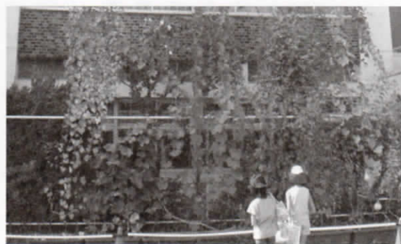
清瀬第四小学校 (緑のカーテン)