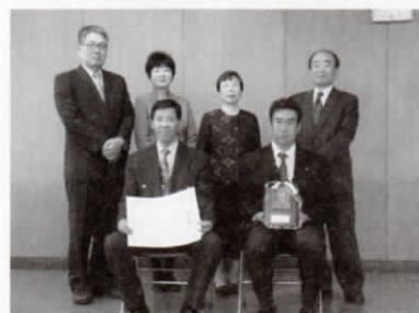
清瀬市少林寺拳法連盟