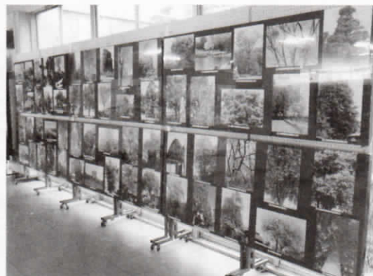
芝山小学校「清瀬の名木・巨木100選」写真展