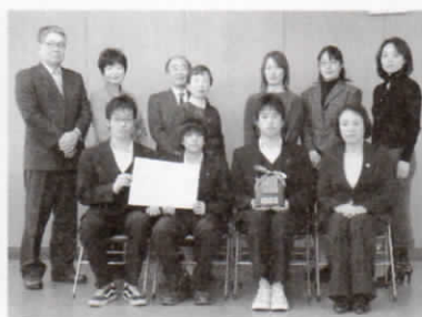
清瀬第五中学校水泳部