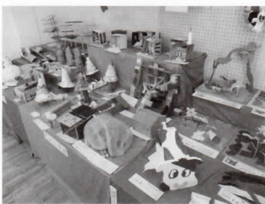
図工・美術作品展 会場の様子