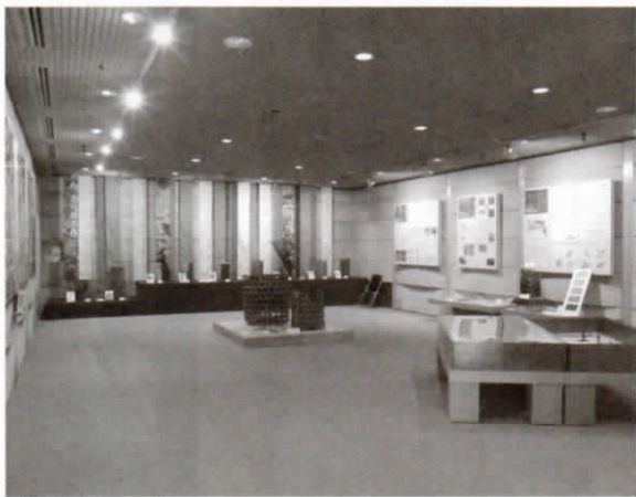
きよせの自然展示室内の様子

こうした自然の中から最も清瀬らしい、そして古くから身近にあった「雑木林」をテーマとして、その役割や四季によって移り変わる美しさと多様性、さらには人々の暮らしとの関わりに焦点を当てた展示です。