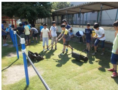
児童集会ドンジャンケン