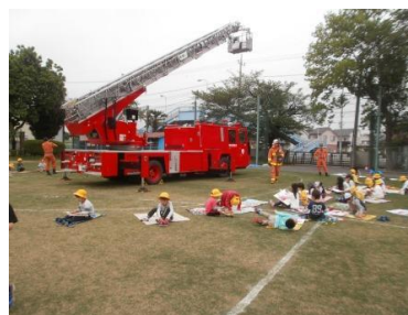
芝生の上で写生会