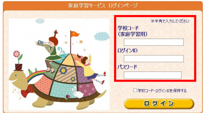
※不明な場合は学校へ問い合わせてください