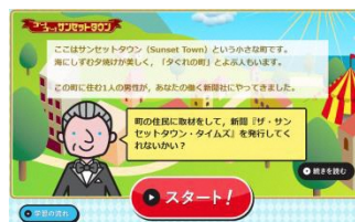
▲家庭での学習履歴が残ります