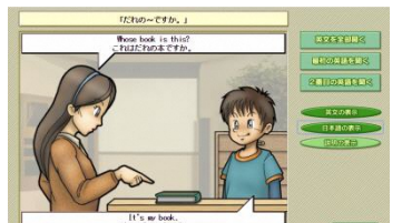
▲英文ごとに繰り返し聞けます