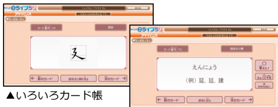
▲いろいろなカード帳

いろいろなカード帳やはやときチャレンジなど、楽しみながら学習するコンテンツもあります