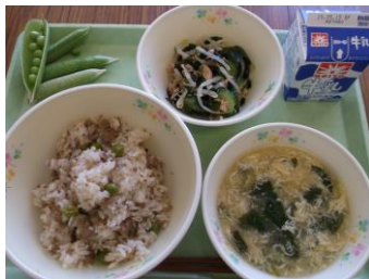
当日の「ピースそばろご飯」

5月8日に2年生がグリーンピースのさやむきをしました。最初に実物をみながらグリーンピースの仲間を学習しました。