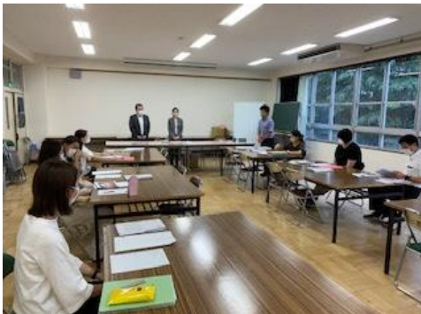
修学旅行プロポーザルの様子です

また、保護者の方の入れ替えに際しましては、受付や誘導等に学校支援本部の皆様、PTA役員の皆様の全面的なご協力をいただけることとなりました。これで教職員は生徒への対応に専念できますので、本当にありがたいことです。このように子供たちの活動の場には、必ず保護者の皆様、地域の皆様の支えがあるのが本校の強みです。コロナ禍にあって、人と人との絆が薄くなっているのではないかとと言われる昨今ですが、学年音楽祭が、生徒を中心に再び学校と保護者、地域の絆を深める機会となればこれに勝る喜びはありません。