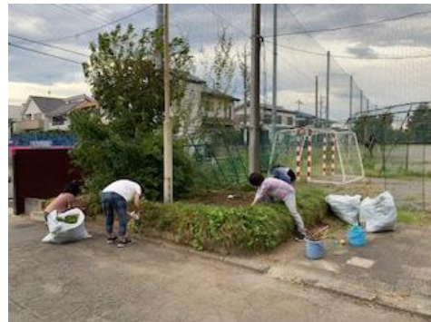
花壇の整備をしていただきました

とは言え、油断は禁物です。様々な制約がある中での実施に変わりはありません。決して無理をせず、細心の注意を払いつつ、今回の取組がコロナ禍の中において学校行事を実現するための一つのモデルとなることを願っております。