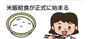
米飯給食が正式に始まる

社会環境の変化とともに、子どもたちを取り巻く環境も大きく変化し、近年では食習慣の乱れや偏った食事による肥満、生活習慣病の増加など、健康状態が心配されるようになりました。そんな中、平成17年に「食育基本法」が制定され、学校給食は食育を推進するための「生きた教材」としての役割も担うようになりました。