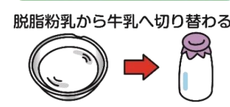
脱脂粉乳から牛乳へ切り替わる