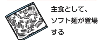
主食として、ソフト麺が登場する