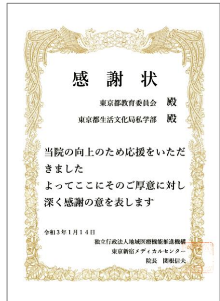
★感謝状も届いています。