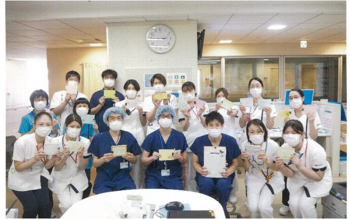
★医療従事者の皆さんから、児童・生徒の皆さんにお写真が届いています。

謹啓 厳寒の候、平素は格別のご厚誼にあずかり、厚く御礼申し上げます。 この度は、35校たくさんの生徒の皆さんの気持ちのこもった、とても素晴らしい応援メッセージをいただき、感謝いたします。 皆様からのメッセージにより、当院を応援してくださる皆様方がいることが職員の何よりの励みとなります。これからも、この状況を乗り越えるべく、職員が一丸となり医療活動へ努めてまいります。 未筆ながら、今しばらく厳しい状況が続くかと存じますが、皆様のご健康と一日も早く平穏な日々が戻りますよう祈念申し上げます。 略儀ながら書面にて御礼申し上げます。