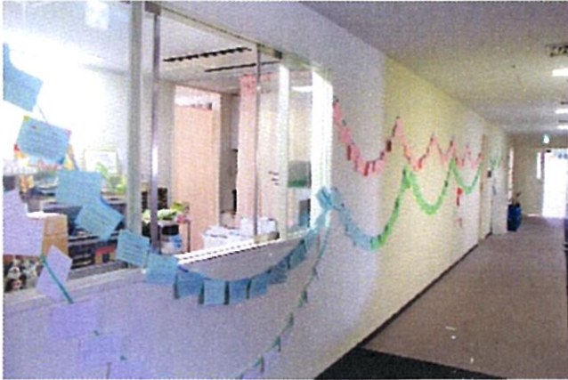
★病院内の壁等にリボンをつないで貼り、職員が歩みをとめて読んでいるとのこと。