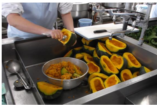
かぼちゃの種は手作業で取り除いています！

とうじ 冬至は 1 年 ねん で一番 いちばん 昼 ひる が短 みじか い日 ひ です。 むかし 昔 むかし の人 ひと は夏 なつ にとれたかぼちゃ かぼちゃ を大 だい 事 じ に保 ほ 存 ぞん していま いま した。そし そし て冬 とう 至 じ の 日 ひ にかぼ か ち ち ゃ ゃ を食 た べると病 び 気 き になら ないとし とし て、かぼ か ち ち ゃ ゃ を食 た べ る る習 なら わ しが残 のこ っていま いま す。