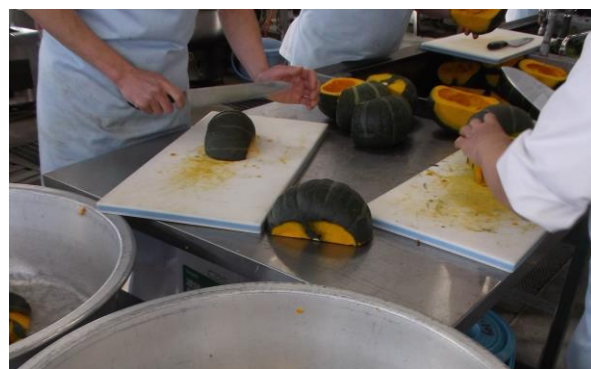
一人2~3個になるように計算してカットします。