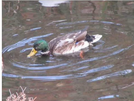
マガモ カモ目カモ科