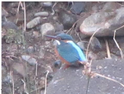
カワセミ フッポウソウ目カワセミ科 雌 雄