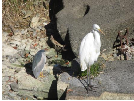
ダイサギとゴイサギ ペリカン目サギ科

季節はすっかり冬となり、関東地方では乾燥した快晴の日が続いています。すっかり干上がってしまった空堀川ですが、最近の水辺を好む鳥だけでなく、日ごろは林や森に住む鳥たちも姿を現して、賑やかになっています。