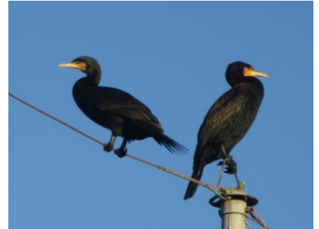
カワウ カツオドリ目ウ科