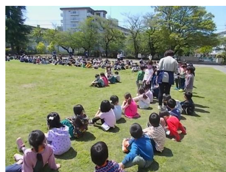
1年生による「自己紹介」