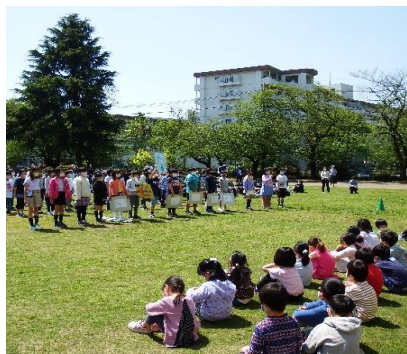
3・4年生による「校歌の紹介」

1年生は、「お礼の言葉」と一人ずつ「自己紹介」をしました。紹介が終わるごとに大きな拍手がおき、1年生を歓迎しました。