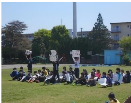
5年生による「七小クイズ」