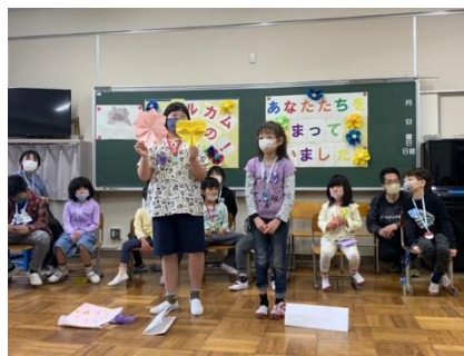
転入生の自己紹介

4月14日(水) 2・3校時に、けやき・ひのき学級の歓迎会が行われました。今年は、1年生4名、転入生13名のたくさんの仲間を迎えました。歓迎の言葉では、6年生が立派に挨拶をしていました。学級・先生紹介も高学年が中心になって行いました。1年生と転入生は、それぞれ自己紹介や得意なことなどを発表しました。縄跳びや絵、折り紙などを発表し、みんなは温かい拍手を送りました。新しい職員の出し物では、ダンスを披露し、盛り上がりました。全員ゲームのニコちゃんゲームでは、「ニコちゃんボール」を回して、太鼓の音が止まった時にボールを持っていた人が自己紹介をします。自己紹介する人は、ラッキーバッジが貰えるので、みんなは自分のところにボールが来てほしくてワクワクしていました。