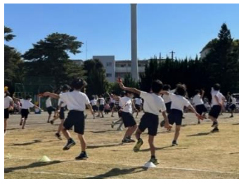
中学年表現 みんなでよっちょれ