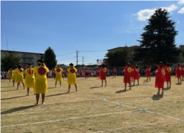
高学年表現 七小ソーラン~この一瞬に全力で~