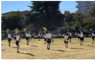
低学年表現 Cheer Up! ~明日も元気! ~