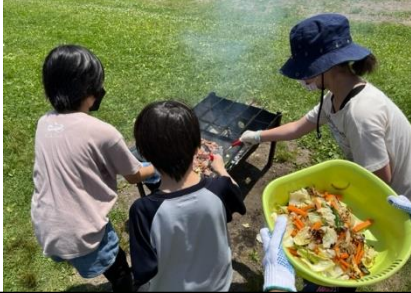
～【1日目】鷹山ファミリー牧場BBQ～

5年生は、6月30日(木)～7月1日(金)の1泊2日で、立科移動教室に行ってきました。事前学習では、「立科ガイドブック」を作成しました。立科の高原地域ならではの自然や、観光産業について調べる中で、移動教室への見通しをもち、意欲を高めていきました。1泊2日という短い期間でしたが、2日間の共同生活、集団行動を通して一人一人がそれぞれの学びを得ました。それと同時に、学年集団としての課題を見つめなおす機会にもなりました。この経験を活かし、2学期はより充実した学校生活を送ることができるよう、励ましながら成長を支えていきます。