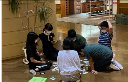
～【1日目】宿舎でのレクリエーション～