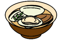
はまぐりのお吸い物

3月3日は「ひな祭り」。女の子の健やかな成長を願ってお祝いをする日本の伝統行事です。現在のように、ひな人形を飾るようになったのは江戸時代のことで、もとは人形を身代わりにして邪気をはらう「流しひな」が起源とされます。行事食として、ちらしずし、はまぐりのお吸い物、ひしもち、ひなあられなど、華やかな食べ物が並びます。