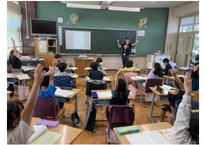
2年国語科の学習：自分の考えを伝えたい。発表したい。と意欲的です。

1学期の生活も折り返し地点に来ました。校長室から出てみると、子供たちが育てているミニトマトや稲、ヘチマがぐんぐん成長しています。観察中の子供から「この前の観察から葉が4枚増えたよ。」「9日で10cmも大きくなった」と笑顔で報告していました。また、新たなスタートを切った清明小の子供たちも、校庭で仲良く遊んだり、真剣な眼差しで学習したりと輝いています。