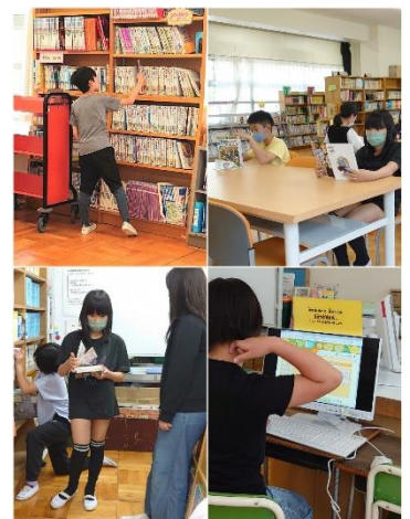
本を探し、じっくり読む5年生