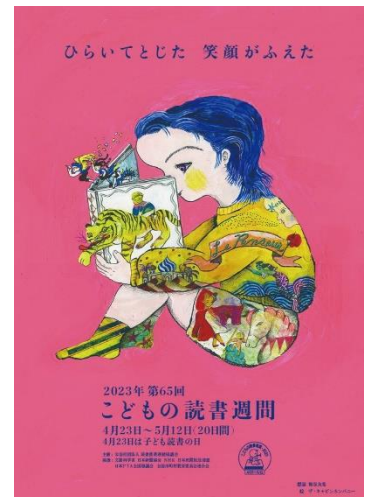
2023 とも読書の日啓発ポスター

子どもの中にある柔らかい脳に刺激を与えながら、 良い言葉と出会い、その言葉を味わい、頭に浮かぶ想像の世界を広げ、優しい賢い人に成長してほしい と願っています。このGWのほんの一コマでも親子で読書の時間を作られてはいかがでしょうか。「わくわく感」を膨らませながら読むことができれば、本の世界をゆったりと旅することができるでしょう。