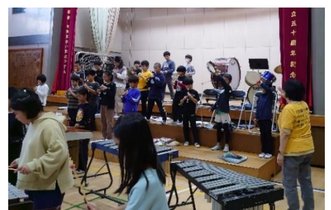
粘り強く気持ちと音を合わせる子供たち

達成感一杯の笑顔が体育館に広がることを想像しています。どうぞお越しください。熱い拍手とねぎらいの言葉が素敵な思い出になることでしょう。