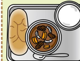
コッペパン・ミルク・カレーシチュー

アメリカから寄贈された小麦粉を使って、パン・ミルク・おかずの完全給食が始まりました。