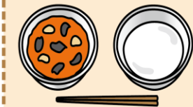
トマトシチュー・ミルク