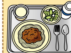
ミートスパゲッティ・牛乳・フレンチサラダ・プリン

パンの種類が増え、めん類も提供されるようになりました。脱脂粉乳のミルクは牛乳へと切り替わりました。