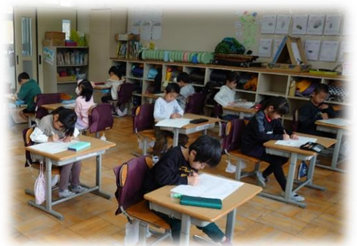
「清四漢検」に熱心に取り組む1年生

ご家庭でも「清四漢検」について、ぜひ話題にしてください。クロームブックを使用したドリルパークの進捗状況をお子様とこまめに確認することで、さらに漢字学習への意欲を高めることができます。また、2月には日本漢字能力検定協会主催の「漢検」も四小を会場として実施します。「親子漢検」と銘打ち、共に学ぶ機会とすることもできます。さらに学習計画をお子様と一緒に考えることや、問題を互いに出し合ったりすることで、お子様のやる気も向上します。そのような経験をすると語彙が増え、物事を考える土台となっていくと思います。ぜひ、ご家庭でも積極的に関わっていただくよう、ご協力をお願いします。