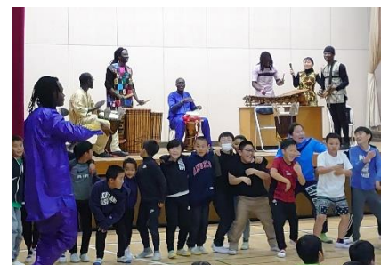
音を全身で楽しむ子供たち