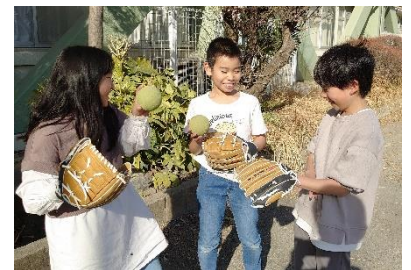
キャッチボールを楽しむ3年生

今、「清四っ子」は、「読書月間」真っ最中。読めば読むほど世界が広がり、自由自在に“心の旅”を楽しむことができます。これは人間の特権です。「人間力」を楽しく鍛えるチャンス。ご家庭でも励ましの言葉をおかけいただければ幸いです。