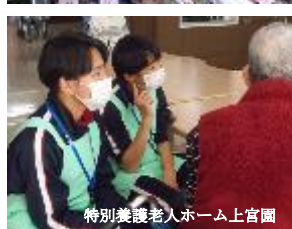
特別養護老人ホーム上宮園