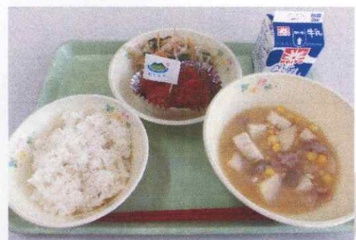
12/9 (火) の献立 ごはん ほたてフライ 茹野菜のごま汁かけ とさんニシ 牛乳

清瀬市では全小中学校でほたても無償提供していただき、給食で使うことができました。新鮮で大きなほたての貝柱に衣をつけて「ほたてフライ」にしました。当日は、給食時間に各学級で北海道森町の紹介や森町で漁業をしている方のお話などをまとめた動画を視聴してもらいました。