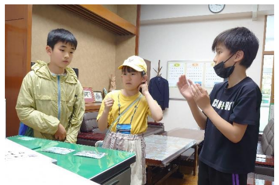
よりよい俳句をつくらうと話合う清四つ子たち

さて、この5月。こいのぼりが大空を舞うがごとく、清々しく伸び伸びとした子供たちの心に出あえることを楽しみに、私たちががんばっていこうと思います。