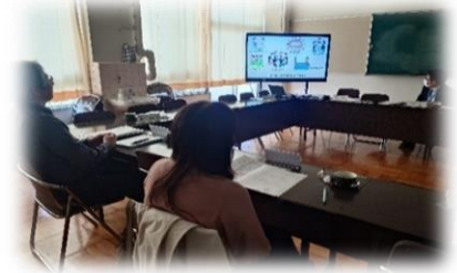
「社会総がかり協育プロジェクト」 清瀬市教育委員会作成動画の視聴